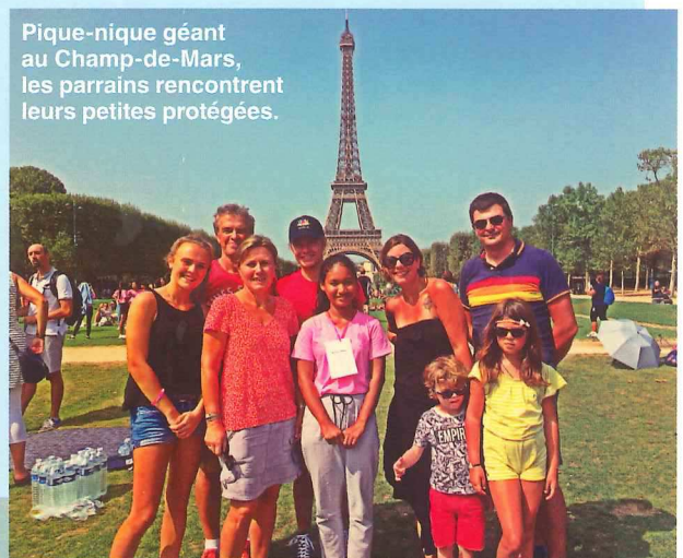
Pique-nique géant au Champ-de-Mars, les parrains rencontrent leurs petites protégées.