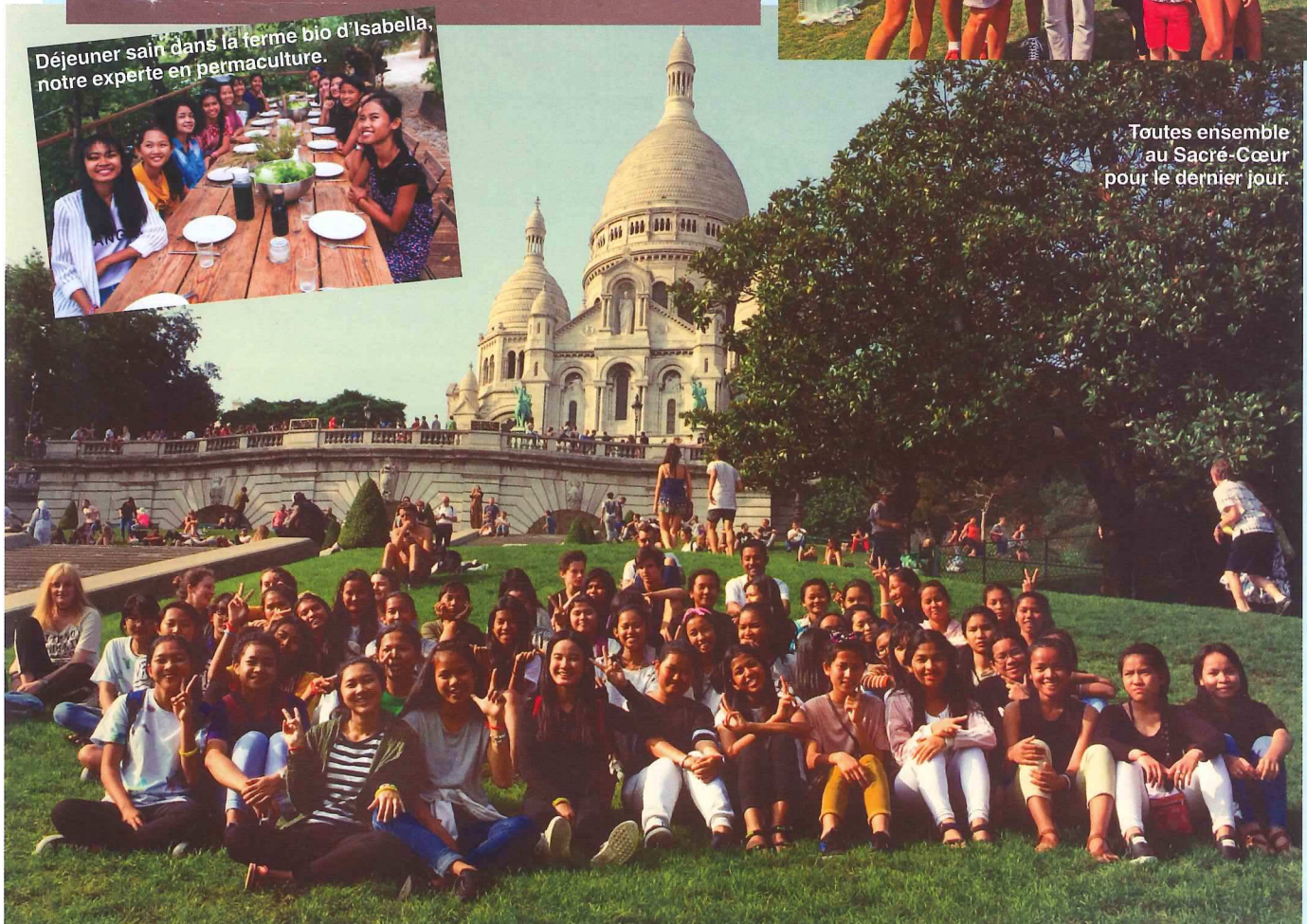
Toutes ensemble au Sacré-Cœur pour le dernier jour.