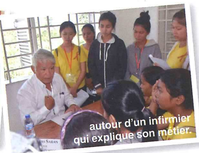
autour d'un infirmier qui explique son métier.